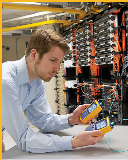
首款 MPO 测试仪支持单模和多模 MPO 光纤测试

预端接光纤要遵照 ANS/TIA 和国际标准进行生产和测试。安装这些线缆时，许多因素可能会影响性能。现场测试是确保预端接光纤符合应用性能需求的唯一方式。若使用单工和双工测试仪，该验证测试费时费力且不准确。为确保安装符合标准，您可选择 MultiFiber Pro 进行测试。