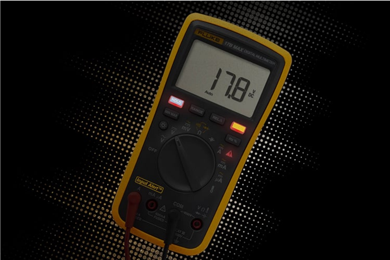
误操作声光报警，减少保险丝损坏