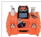
带工作台的收容箱 CC-82