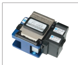
光纤切割刀 FC-6 / FC-6R 系列