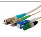
可用于 Lynx-Custom Fit™ 热缩快接